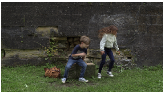
Deux scènes du tournage du film.